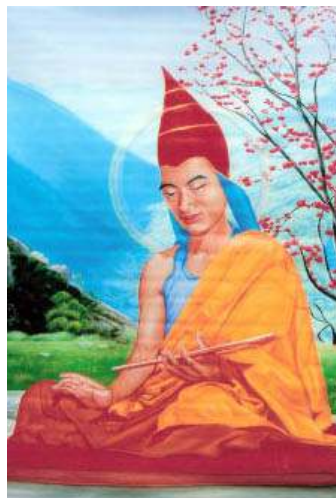
འདགས་པ་རྣམ་གྲོལ་སྡེ། Vimuktisena