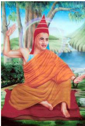
ཕྱོགས་སྐད། Dignaga