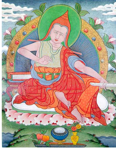
ཟླ་བ་གྲགས་པ། Candrakirti