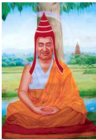
ཞེ་བ་མཚོ། Santideva