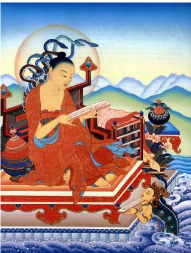
ལྷ་སྤྲུག། Nagarjuna

The unequalled Buddha Shakyamuni, endowed with compassionate skill in means, performs countless and extensive deeds of body, speech, and mind, solely intending only benefit for all beings. Of these deeds, those of speech are supreme. The seventeen learned and accomplished masters of glorious Nalanda University are among the infinite assembly of disciples fortunate to be the recipients of such activity. Not only is the continued existence of the Buddha dharma, complete and untainted, in countries such as Tibet and Mongolia due solely to the kindness of these sublime and great beings activities of speech, but countless sublime beings have reached the high levels of realization of the stages and paths through studying and contemplation their writings.