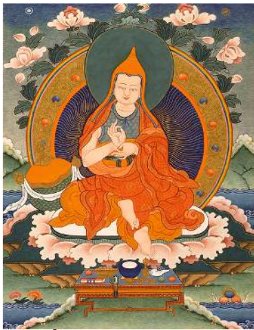
ཐོགས་མེད། Asanga