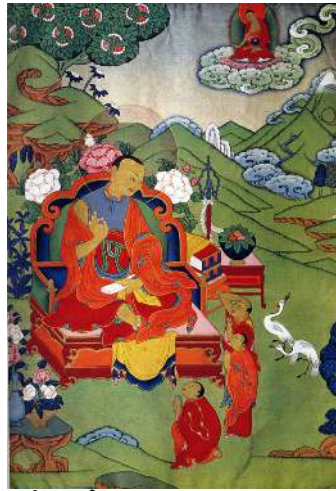
དབྱིག་གཉེན། Vasubhadu