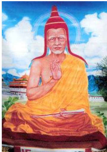
ཞེ་བ་མཚོ། Santaraksita