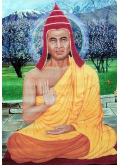
སྤྲུའོད། Sakyaprabha