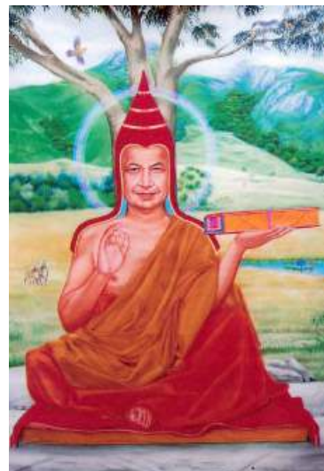
སངས་རྒྱས་བསྐྱེད་སྤྲུག། Buddhapalita