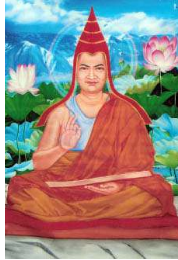
སེང་གེ་བཟང་པོ། Simhabhadra