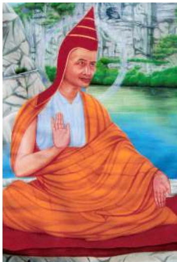
འཕགས་པ་ལྷ། Aryadeva